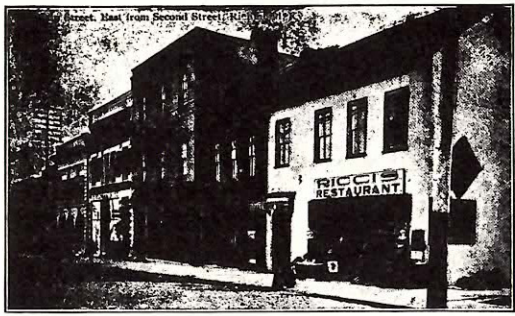
SCENE ON MAIN STREET: RICHMOND, KENTUCKY

on the platform, from S. R. & Co., order No. G620333.